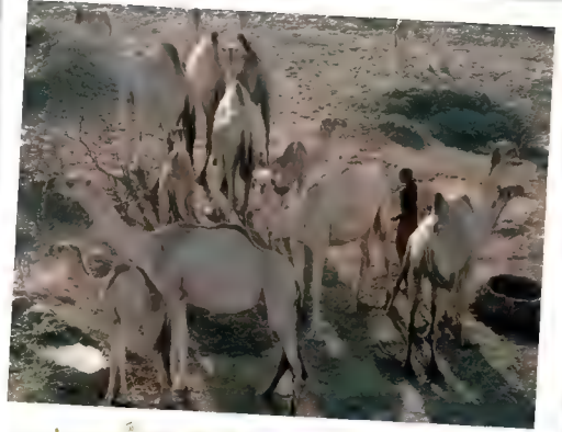
حَوْلَ الْأَبَارِ الْمَحْفُورَةِ فِي الصَّحْرَاءِ، يَحْصُلُ التَّجَمُّعُ الْعَامُّ!

أَخِيرًا، بَعْدَ حَيَاةٍ حَافِلَةٍ بِالْعَمَلِ، تُقَدِّمُ الْجِمَالَ جِلْدَهَا الَّذِي يُدْبَعُ، فَتُصْنَعُ لِلتَّوْمِ مِنْهُ أَحْذِيَةٌ وَحَقَائِبُ وَأَحْزِمَةٌ غَالِيَةُ الثَّمَنِ.